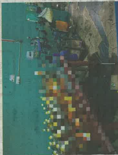
Antara peralatan ditemui dalam premis diserbu KPDNHEP.