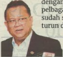
Alexander Nanta Linggi, Menteri Perdagangan Dalam Negeri dan Hal Ehwal Pengguna

Ini bermakna kita sudah meningkatkan persaingan dan dengan adanya persaingan serta pelbagai jenama di pasaran, sudah semestinya harga akan turun dengan sendirinya