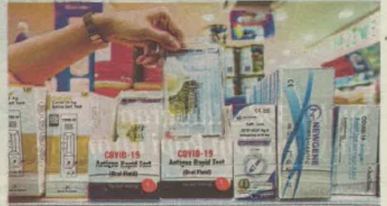
Penggunaan kit ujian sendiri sudah menjadi keperluan rakyat bagi mengelak penularan COVID-19.

"Penggunaan kit ujian sendiri itu bukan lagi pilihan, sebaliknya sudah menjadi keperluan rakyat dan kita akan sentiasa mengutamakan pengguna," katanya.