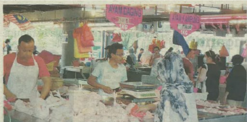
AYAM merupakan salah satu daripada 11 barangan kawalan yang ditetapkan kerajaan sempena sambutan Deepavali tahun ini. – GAMBAR HIASAN