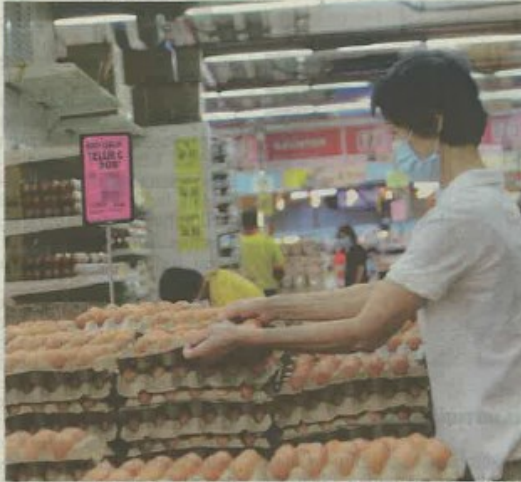
TELUR ayam antara barangan yang kerap mengalami turun naik menjelang musim perayaan utama di negara ini. - GAMBAR HIASAN

Sebenarnya bilangan barangan dan harga semasa kawalan tidak penting. Yang utama ialah kesannya kepada pengguna terutama selepas pelaksanaan skim tersebut.