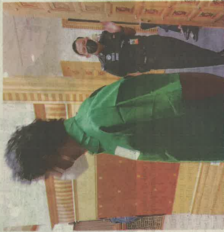
PENGARAH syarikat warga tempatan dipenjara tiga tahun kerana gagal mematuhi award TTPM.

Tambahnya lagi, setelah selesai perbicaraan, OKS gagal membuktikan keraguan yang munasabah di peringkat pembelaan.