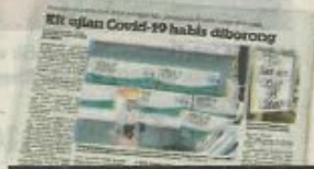
KERATAN Kosmo! semalam.

Beliau mengulas laporan Kosmo! mengenai nasib dialami peniaga apabila bekalan kit ujian Covid-19 habis diborong selain kekusaran pengguna sekiranya