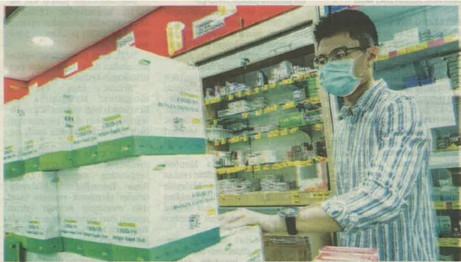
MASALAH kekurangan RTK dijangka pulih dalam masa terdekat selepas kilang-kilang tempatan diarahkan meningkatkan pengeluaran produk tersebut. - GAMBAR HIASAN

Cuti perayaan, kes Covid-19 naik punca stok habis