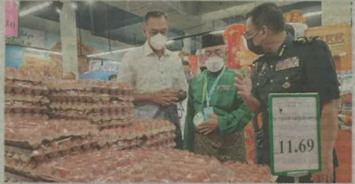
Rosol (kiri) melihat bekalan telur ketika Walkabout, kebersediaan barangan keperluan pengguna di kawasan luar bandar di Pasaraya BS Freshmart Bukit Goh, Kuantan pada Jumaat.

pengguna diterima berhubung kenaikan harga ayam melampau membabitkan kawasan luar bandar.