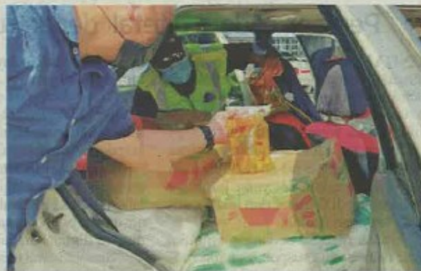
Anggota penguat kuasa memeriksa Proton Iswara yang sarat mengandungi barang subsidi seberat 542kg dalam serbuan di Kampung Bendang Pak Yong, Tumpat pada Isnin.

"KPDNHEP Kelantan tidak akan berkompromi dengan mana-mana individu atau kumpulan yang terlibat dengan aktiviti penyeludupan," kata beliau.