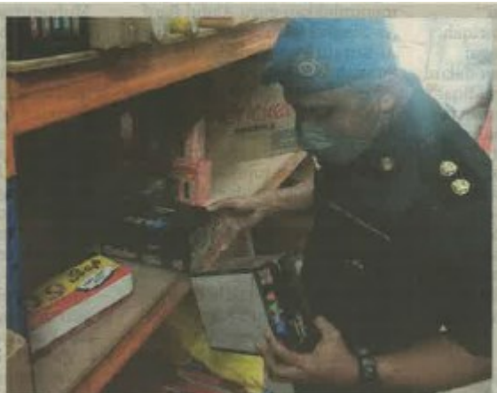
ANGGOTA KPDNHEP Pulau Pinang menjalankan pemeriksaan di dua premis dipercayai menjual barangan menggunakan cap dagang palsu di sekitar Butterworth, kelmarin.

"Jumlah sitaan dianggarkan bernilai RM4,087.50," katanya dalam kenyataan di sini, semalam.