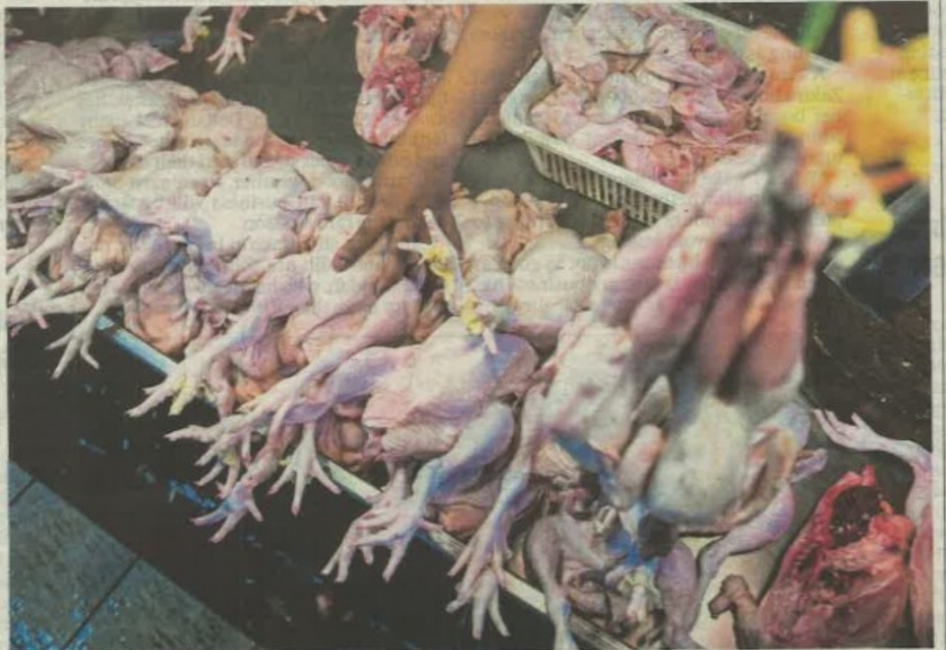
The price of chicken soared last month due to low supply.

"If the local chicken production is sufficient and the price is sta-