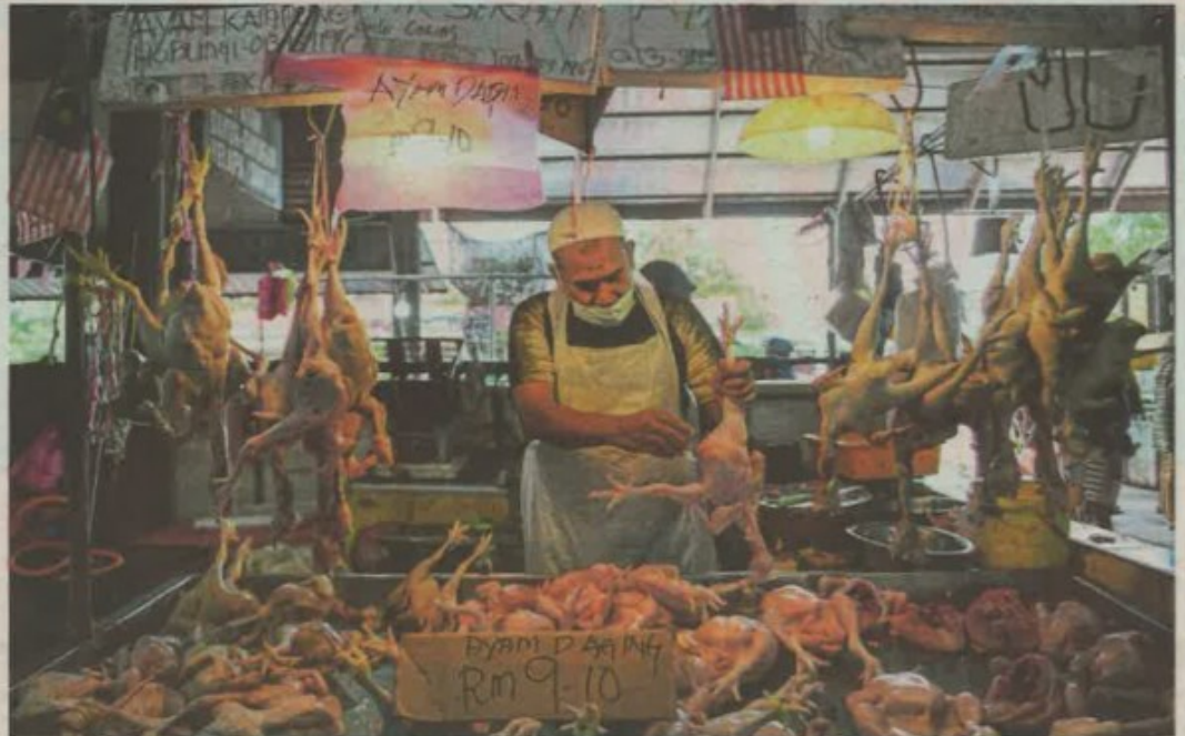
Tinjauan di Pasar Chabang Tiga, Kuala Terengganu mendapati penurunan harga ayam membantu rakyat dapatkan barangan keperluan pada harga munasabah.

"Kita bagi kelonggaran sementara untuk menampung kekurangan, jika pengeluaran ayam tempatan adalah mencukupi dan harganya stabil, kita akan hen-