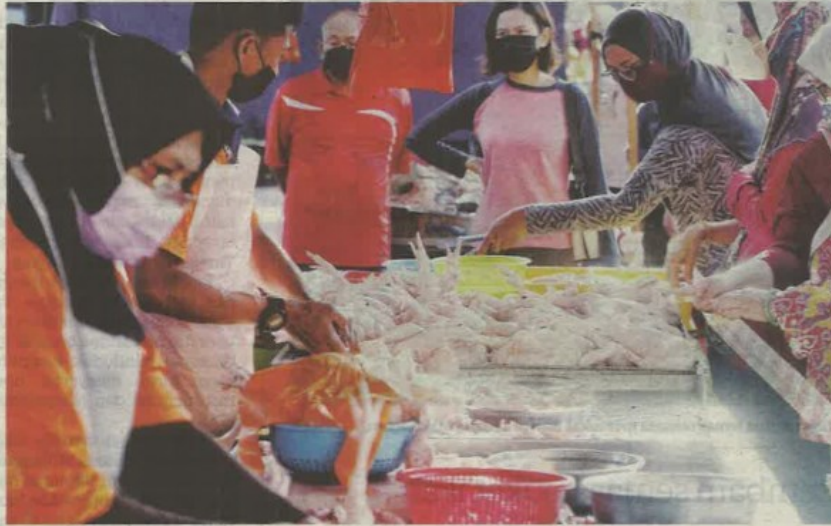
HARGA ayam standard di beberapa tempat mula dijual murah dan ada yang dibawah paras siling hingga mendorong kerajaan melanjutkan SHMKM sehingga 4 Februari depan. — GAMBAR HIASAN

Laporan disiarkan laman rasmi FAMA itu namun menunjukkan Kangar, Perlis; Kuala Terengganu, Terengganu dan Seremban, Negeri Sembilan dijual tinggi da-