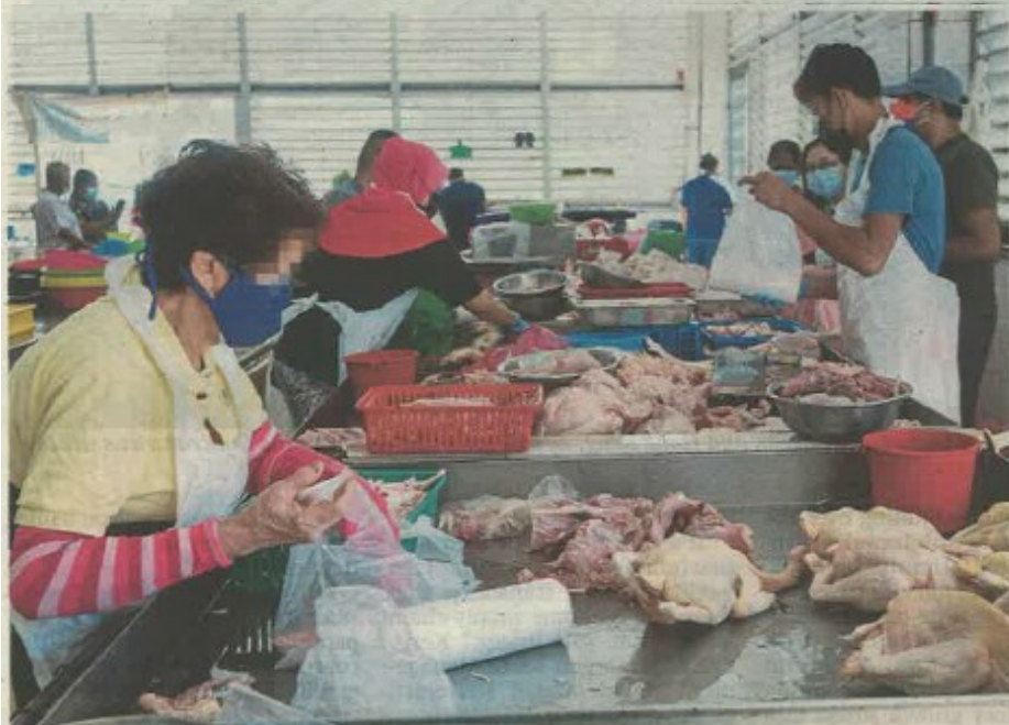
We must tackle monopolistic practices in the food supply chain. FILE PIC