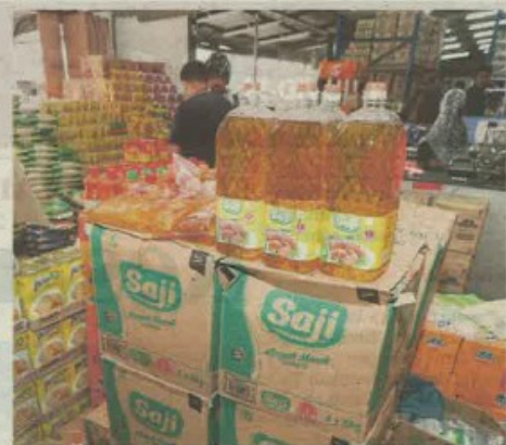
ANTARA minyak masak dijual di sebuah kedai runcit ketika tinjauan di sekitar Kota Bharu, semalam.

"Kita juga sudah menyasarkan peruncit mendapatkan bekalan minyak masak daripada pembekal yang disenaraikan," katanya.