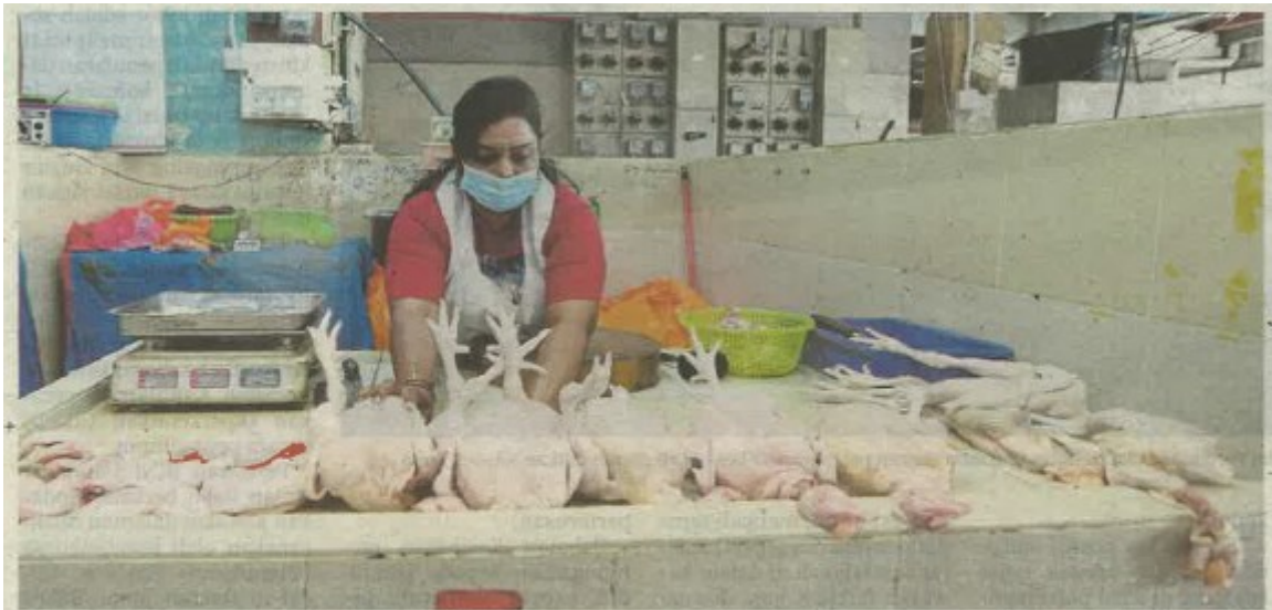
SEORANG peniaga menyusun ayam untuk dijual ketika tinjauan di Pasar Jalan Othman, Petaling Jaya, semalam.