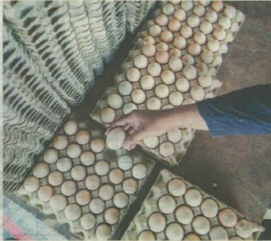
BEKALAN ayam dijangka berlebihan Februari ini sekali gus menurunkan harganya di pasaran.

Bercakap kepada Utusan Malaysia , Menteri, Datuk Seri Alexander Nanta Linggi bagaimanapun berkata, pihak kementerian itu masih memantau situasi semasa unjuran per-