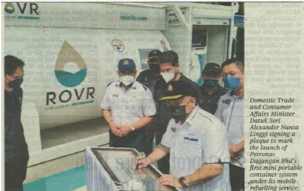
Domestic Trade and Consumer Affairs Minister Datuk Seri Alexander Nanta Linggi signing a plaque to mark the launch of Petronas Dagangan Bhd's first mini portable container system under its mobile refuelling service.