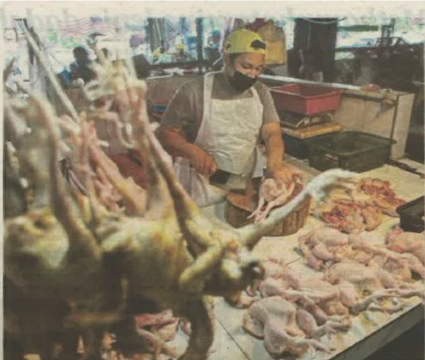
PENIAGA ayam segar di Pasar Chabang Tiga mengeluh apabila pembekalan ayam dihadkan oleh pembekal menjelang musim perayaan Tahun Baharu Cina.

Pada masa sama, menurutnya, apabila bekalan ber-