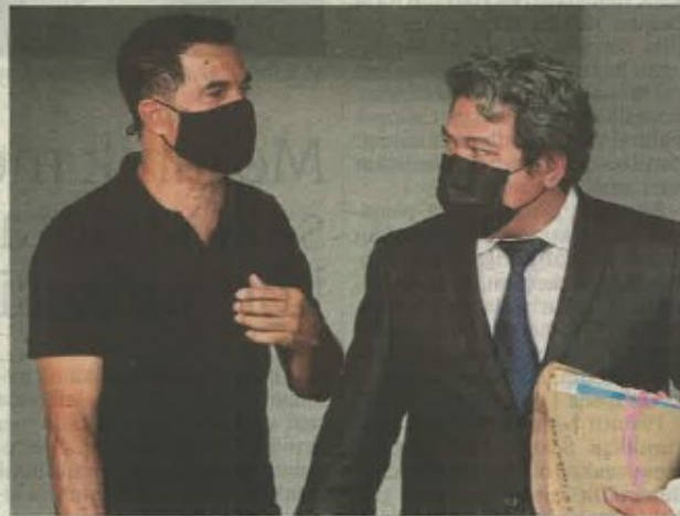
A Nadaraja (kiri) di Mahkamah Sesyen Seremban, semalam.

Kesalahan dilakukan pada 20 Oktober 2020, di antara jam 4.50 petang hingga 5.20 petang di restoran Ginger NOI Thai Kitchen dan restoran Harum Manis di Mesamall, Bandar Baru Nilai.