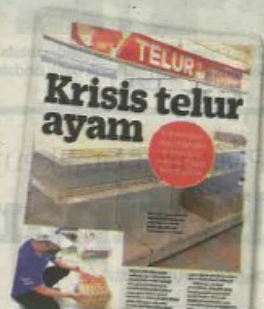
KERATAN Kosmo! semalam.

sakan panas, tomyam dan sebagainya dan telur antara bahan utama.