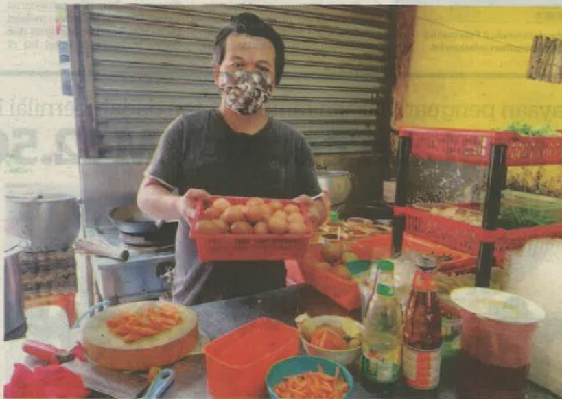
SEORANG pekerja Restoran G'Sinar di Johor Bahru menunjukkan bekalan telur yang ada di restoran itu semalam.

"Saya hanya boleh beli dua papan sahaja telur setiap hari biarpun merupakan pelanggan tetap sejak 10 tahun lalu dan membeli 300 biji telur Gred B setiap dua hari sekali," katanya.