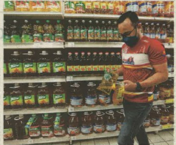
ORANG ramai masih bergantung kepada minyak masak paket berikutan harga minyak dalam botol yang kekal tinggi.

"Menteri kena tanya pembekal, Sime Darby, Feida, Lam Soon, tanya mereka kenapa harga RM38? soalnya ketika dihubungi, semalam."