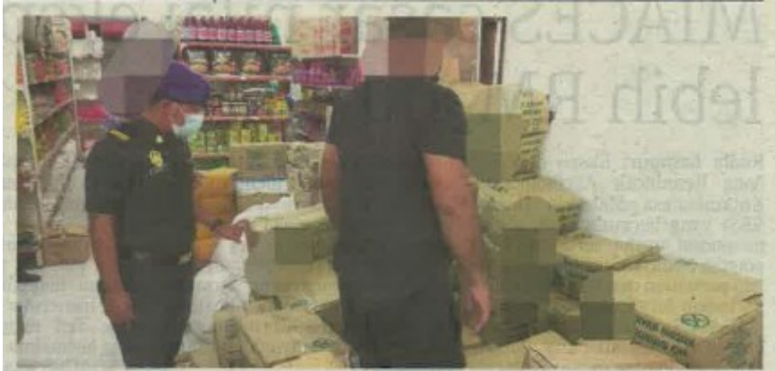
Penguat kuasa KPDNHEP memeriksa minyak masak peketa bersubsidi yang disimpan di sebuah pasar raya di Kota Warisan Sepang.