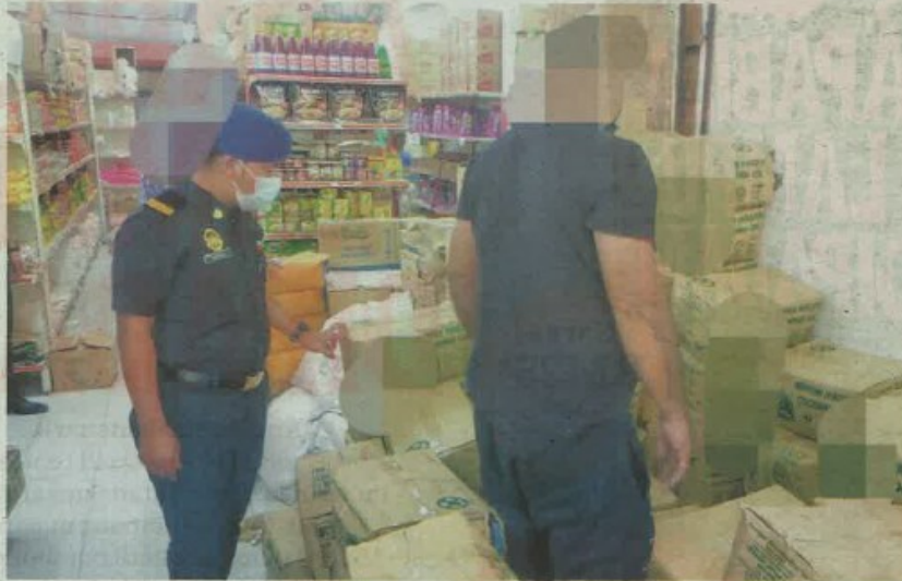
ANGGOTA penguat kuasa KPDHNEP Sepang memeriksa sejumlah bekalan minyak masak peket bersubsidi yang disorokkan di stor sebuah pasar raya di Kota Warisan, Sepang dalam serbuan pada Jumaat lalu.

"Situasi ini telah memberi isyarat kepada pasukan pemeriksa untuk membuat siasatan susulan ke atas premis yang diadakan di bawah Akta Kawalan Bekalan