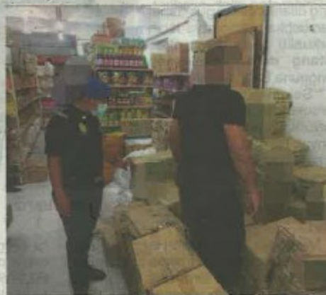
Sebuah pasar raya di Kota Warisan, Sepang diserbu penguatkuasa KPDNHEP selepas didapati menyorok minyak masak bersubsidi dalam operasi yang dijalankan pada Jumaat.

"Tindakan dijalankan di bawah Seksyen 19, Akta Kawalan Bekalan 1961 dan Peraturan 13(1)&(2) Peraturan Kawalan Bekalan 1974," katanya.