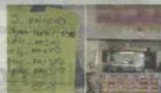
Perkongsian mangsa harga 'cekik darah' sebuah kedai makan di Port Dickson.

Along jalan kecam saya. Saya bertanya untuk mendapatkan kepastian harga. Gambar dibawah adalah receipt ikatan sembel petai dan sembel sotol ialah 2 sudu besar teh untuk satu ping. Air ialah limau asam dan sirap am. Adakah harga ini valid untuk makan sekarang?