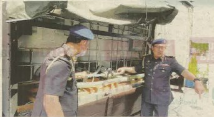
ANGGOTA penguat kuasa KPDNHEP memeriksa tangki fiber yang diubah suai dalam sebuah lori di Ipoh kelmarin.

Ujarnya, semakan juga mendapati pemandu lori yang beru-