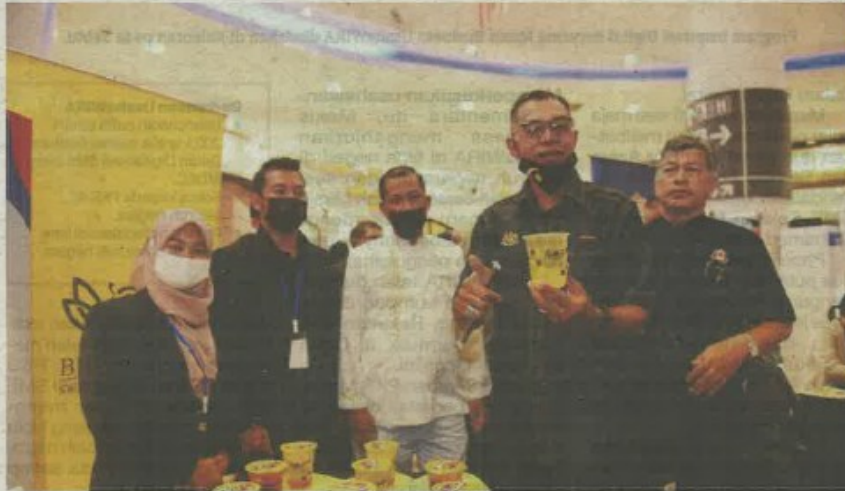
Rosol (dua dari kanan) ketika mengunjungi salah satu reruai pada program PJFB di Aeon Mall Shah Alam pada Jumaat.

"PJFB di Sarawak, Johor dan Pahang tahun ini me-