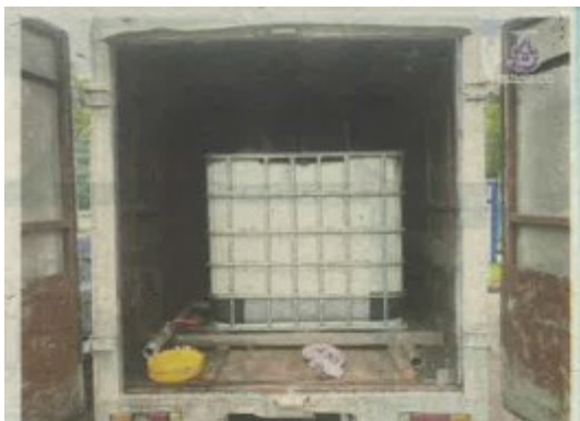
LORI dengan tangki minyak yang sudah diubah suai dirampas dalam serbuan di stesen minyak dekat Ulu Tiram.