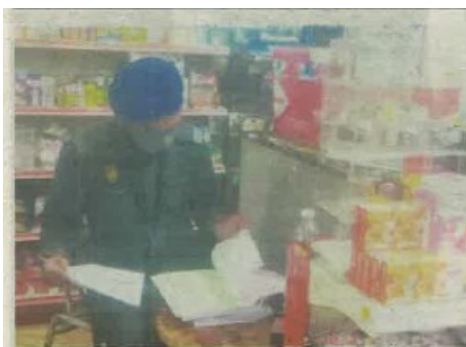
PENGUAT KUASA KPDNHEP mengeluarkan notis kepada pemilik kedai runcit.