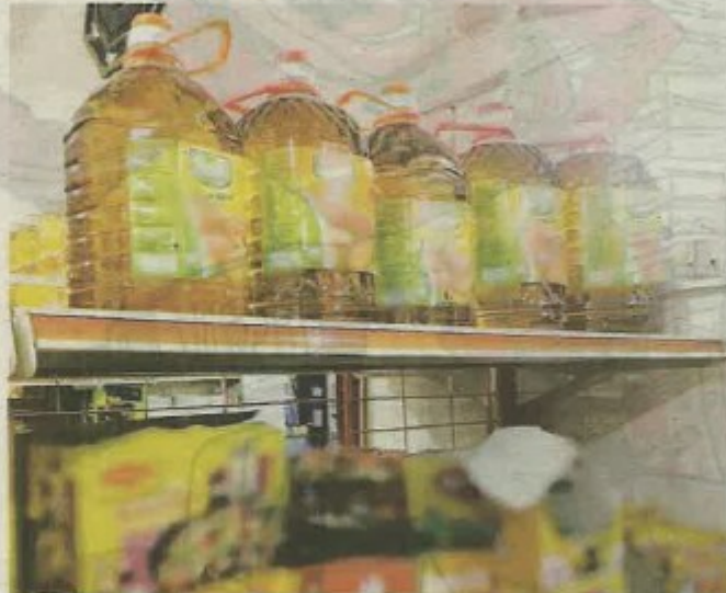
SEBANYAK lima botol minyak masak yang dijual pada harga RM41.90 sebotol di sebuah kedai runcit dekat Kadok, Kota Bharu disita dalam serbuan kelmarin.

"Anggota penguat kuasa KPDNHEP telah menyerahkan Notis Pengesahan Maklumat Ba-