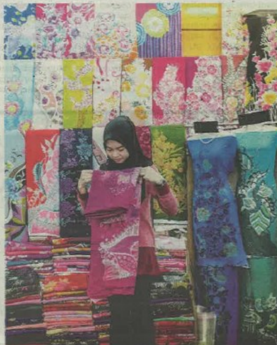
PENGUSAHA batik asli Terengganu disarankan agar mempatenkan produk mereka dengan MyIPO.

"Logo GI itu bukti sah produk berkenaan keluaran batik asli Terengganu sebagai panduan kepada pengguna," katanya.