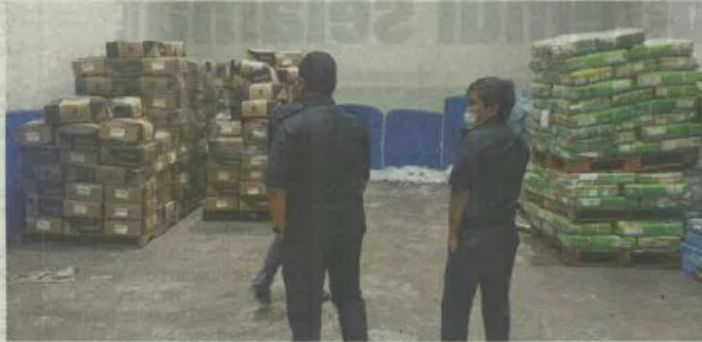
Agensi penguat kuasa berjaya mengesan kes pengimport daging sejuk beku menggunakan logo halal dari luar negara dan tulisan halal yang diragui dalam serbuan di premis sekitar Pulau Indah, Shah Alam tahun lalu.

OKS dipenjara 15 bulan jika gagal membayar denda tersebut.