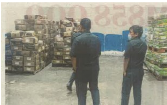
KPDNHEP Selangor menyerbu premis yang menempatkan daging sejuk beku di sebuah premis di Pulau Indah.