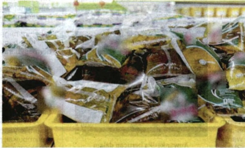
Warga asing boleh membeli minyak masak bersubsidi namun tertakluk kepada had pembelian seperti rakyat Malaysia.

"Lawatan audit ke sebuah premis peruncit di Kelantan yang dimiliki oleh sebuah syarikat pada 23 Julai 2024 mendapati syarikat tersebut telah beroperasi sebagai kedai makan dan menyimpan sebanyak 204