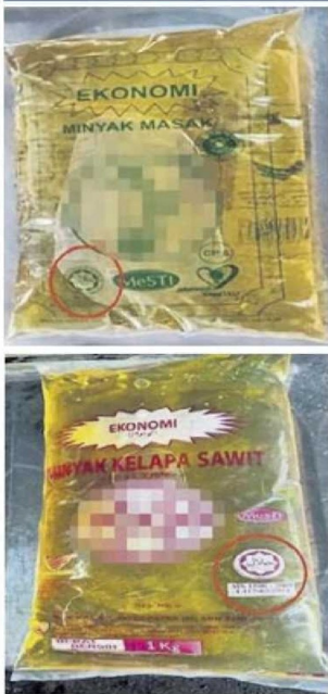
■部分没有获得清真认证的公司仍在包装上印有清真认证标志。