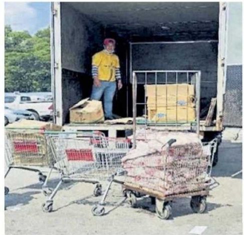
■一家零售店超额销售包装食油给食品供应商。

未记录任何补贴食用油的交易细节，只记录了购买食用油的罗厘车牌号码，涉及71万3249公斤、总值178万令吉的包装食油。” 对此，内贸部已将这3家零售店在ECOSS的户头停用，其中，售卖食油给食品供应商的零售商的调查已进入最后阶段，完成后将提呈给检察官采取进一步行动。 另外两家零售店的相关报告已交给该部执法组展开鉴定和进一步调查工作。