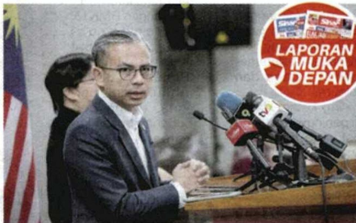
Fahmi ketika sidang media mingguan di Bangunan Parlimen pada Isnin.

Kewangan II, Datuk Seri Amir Hamzah Azizan memaklumkan bahawa rasionalisasi subsidi RON95 akan dilaksanakan pada separuh kedua 2025.