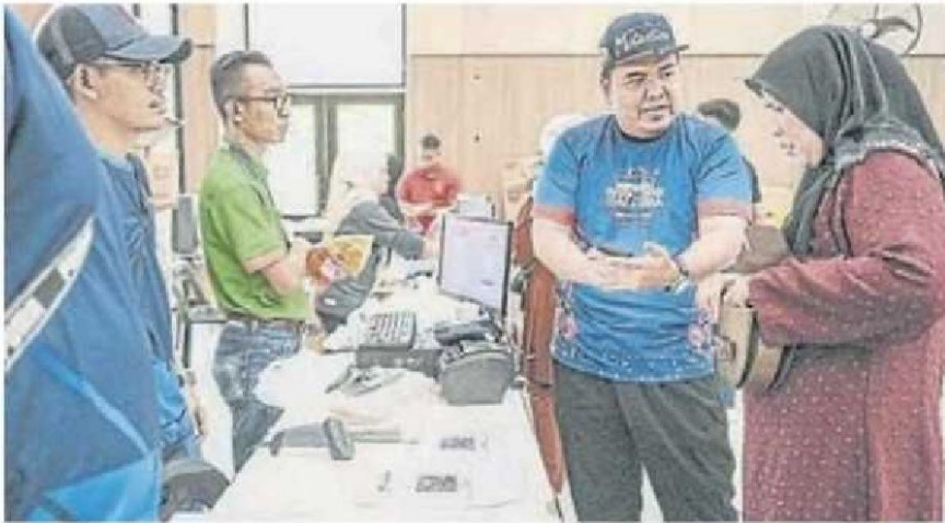
■国内贸易及生活费部官员向一位顾客讲解eCOSS应用程式的使用方式。