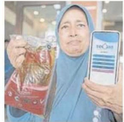
■阿西雅：现场有工作人员协助不熟悉科技者。

（新山21日讯）由国内贸易及生活费部推行的食用油补贴计划（eCOSS），目前在柔佛试点实行，并获得民众正面回馈，认为该计划有效确保受补贴的食用油发放给真正有需要的群体。