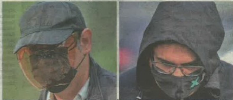
Kedua-dua tertuduh didakwa atas pertuduhan menerima wang RM218,524.80 hasil pengubahan wang haram.

Pendakwaan dikendalikan Timbalan Pendakwa Raya Tan Siew Ping manakala