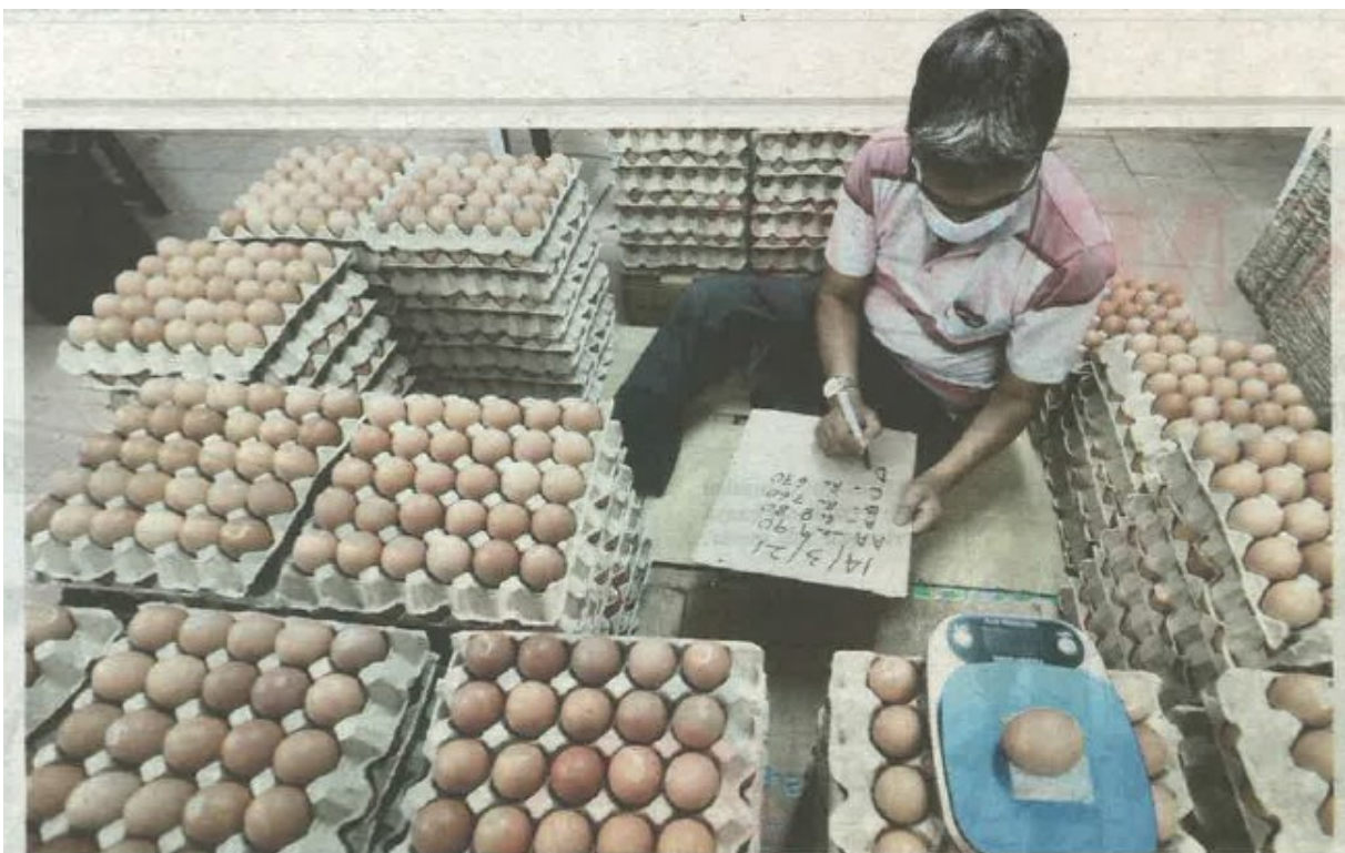
PEKERJA pembekal telur di Kuala Lumpur memeriksa bekalan telur yang baru sampai dari Pahang. Menurutinya, tiada isu kenaikan harga telur kerana bekalan yang ada berlebihan dan harga turun mendadak menyebabkan pembekal menanggung kerugian.