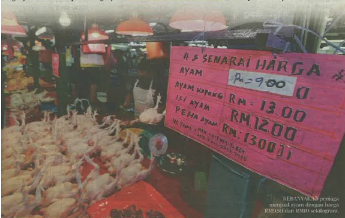
REBANYAKAN peniaga menjual ayam dengan harga RM9.50 dan RM10 sekilogram.

Peniaga tertekan dan terhimpit apabila harga ayam naik