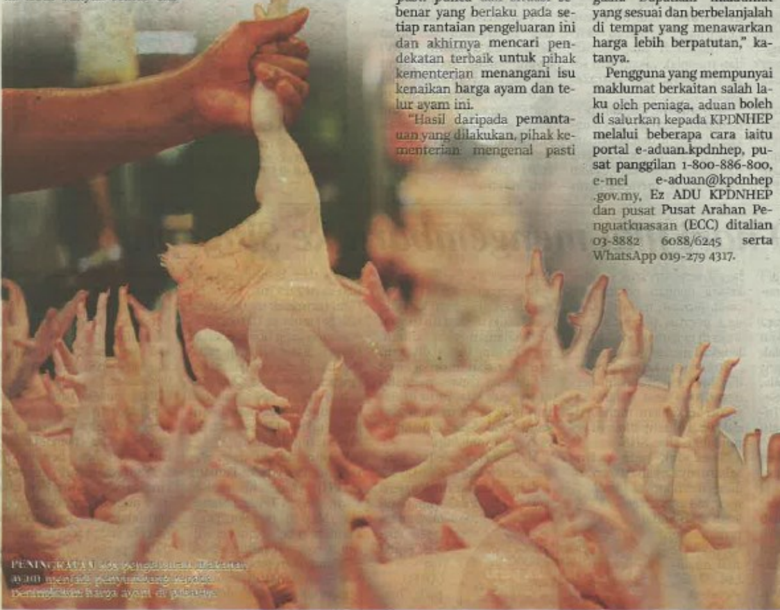
PENINGKATAN kos pengeluaran makanan ayam menjadi petyawandang kepada peningkatan harga ayam di pasaran.

Pengguna yang mempunyai maklumat berkaitan salah laku oleh peniaga, aduan boleh di salurkan kepada KPDNHEP melalui beberapa cara iaitu portal e-aduan.kpdnhep, pusat panggilan 1-800-886-800, e-mel e-aduan@kpdnhep.gov.my, Ez ADU KPDNHEP dan pusat Pusat Arahkan Penguatkuasaan (ECC) ditalian 03-8882 6088/6245 serta WhatsApp 019-279 4317.