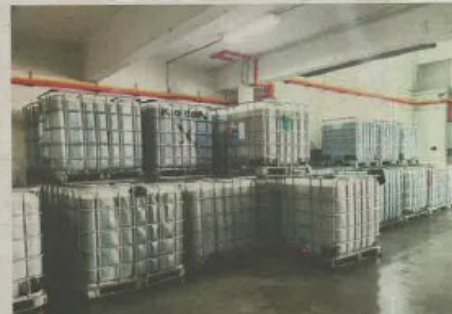
SEBANYAK 36 tangki fiber dirampas dalam serbuan di sebuah kilang tersebunyi di Rawang, Gombak.