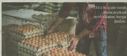
TELUR ayam turut mencatatkan peningkatan harga jualan.

Jagung dan Soya diimport dari luar negara di harga ditentukan oleh pasaran komoditi & bergantung kepada permintaan dan bekalan