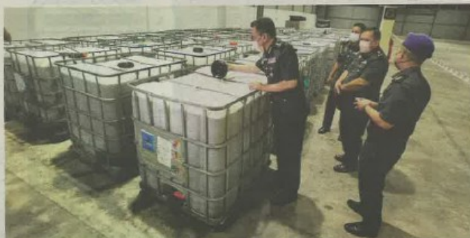
NILAI keseluruhan rampasan di sebuah kilang di Rawang dianggarkan bernilai RM87,300.

"Hasil operasi pada jam 11.30 pagi itu, 36 unit tangki fiber berkapasiti 1,000 liter dan 31 tan minyak masak