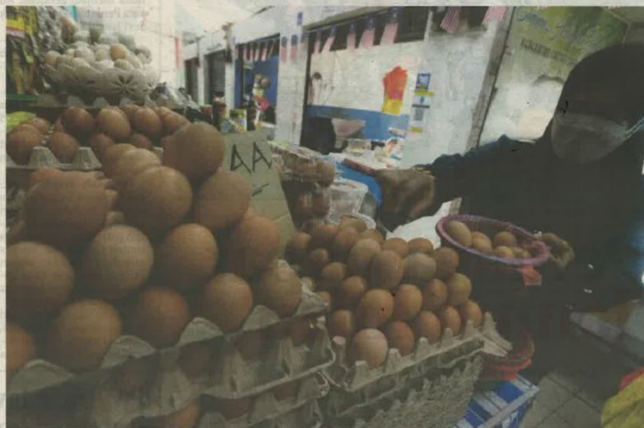
NORLIZA menyusun telur yang dijualnya di Pasar Seksyen 6, Shah Alam.

Bekalan telur ayam amat terhad, peniaga hanya dapat separuh daripada pesanan