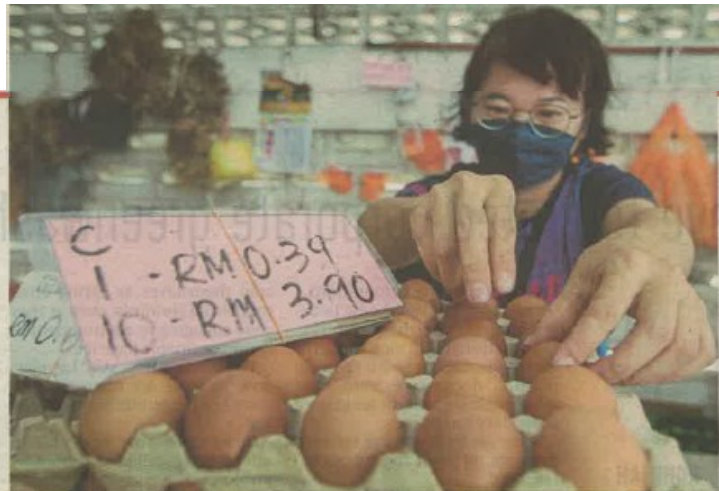
If there is no intervention from the government, the prices of chicken and eggs will rise even further.

Nanta said RM200 million of the RM262 million allocation would be provided as a six-month