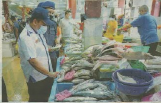
KPDNHEP sentiasa membuat pemantauan harga barangan keperluan demi menjadi kebajikan pengguna. - GAMBAR HIASAN

"Kenyataan itu bukan sengaja diada-adakan, tetapi ia berdasarkan maklumat daripada sesi libat urus pada 6 Januari lalu bersama Kementerian Pertanian dan Industri Makanan, Jabatan Perkhidmatan Veterinar, Kementerian Kewangan, wakil Agro Bank dan wakil-wakil daripada Perse-