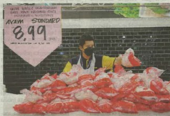
Harga siling ayam dijangka naik pada awal bulan depan selepas tamat Skim Harga Maksimum Keluarga Malaysia.

Bagaimanapun, katanya, kenaikan itu tidak akan membeban-