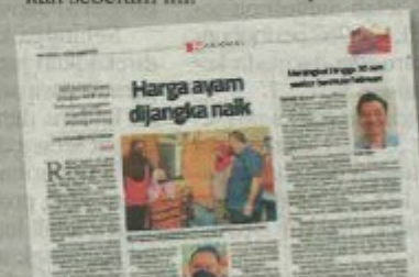
Laporan Sinar Harian pada Sabtu.

Justeru, beliau berkata, kerajaan termasuk KPDNHEP sudah mengambil langkah proaktif untuk mengimbangi kenaikan harga ayam dan telur di pasaran seperti yang telah diumumkan sebelum ini.