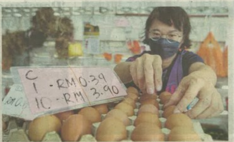
KENAIKAN harga telur dijangka selepas sambutan Tahun Baharu Cina.

"Sekiranya skim ini diteruskan, pihak Kementerian dimaklumkan menjejaskan hasil pengeluaran ayam dan