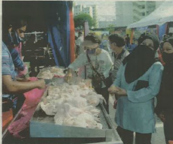
ORANG ramai membeli ayam di salah sebuah gerai dalam Program Jualan Keluarga Malaysia di pekarangan Masjid Al-Bukhary, Georgetown, baru-baru ini.

364 kes direkodkan dengan 269 kompaun bernilai RM95,000 dikeluarkan atas pelbagai kesalahan.