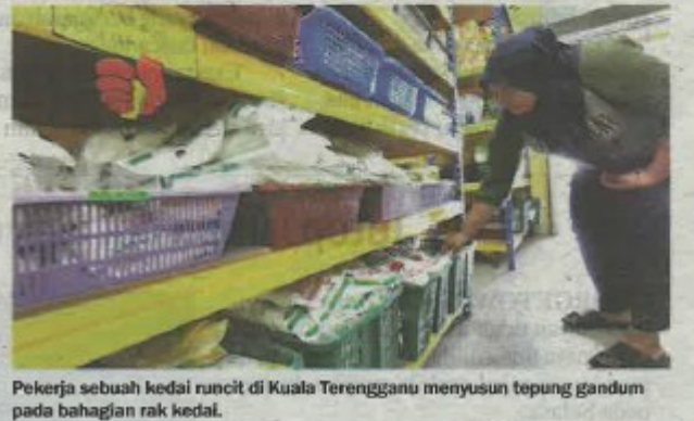
Pekerja sebuah kedai runcit di Kuala Terengganu menyusun tepung gandum pada bahagian rak kedai.