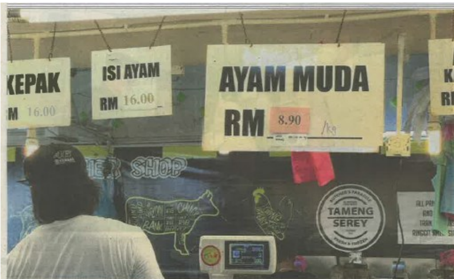
Peniaga mula mengenakan caj pemotongan ayam di sebuah pasar di Kempas, Johor.