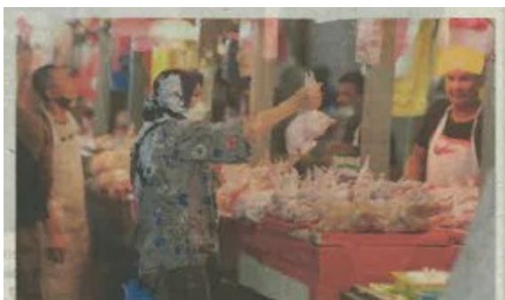
PENGUNJUNG memilih ayam bersih yang dijual di Pasar Chow Kit, Kuala Lumpur.