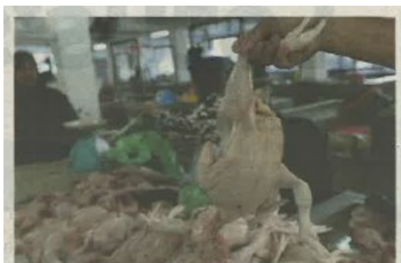
TINJAUAN di Pasar Berek 12, Kota Bharu mendapati kebanyakan peniaga ayam segar tidak mempamerkan harga ayam sekilogram yang dijual.