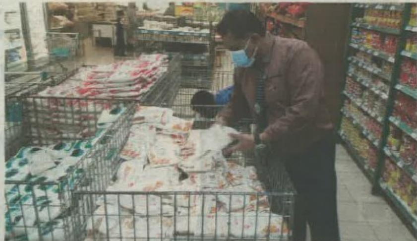
MAS Imran menunjukkan bekalan tepung gandum yang terhad di Pasaraya Econsave Cash and Carry cawangan Taman Scientex, Pasir Gudang.

"Mengikut maklum balas pelanggan, kebanyakan tempat mengalami masalah sama dan saya harap ia tidak berpanjangan," katanya. Sementara itu, Pengurus