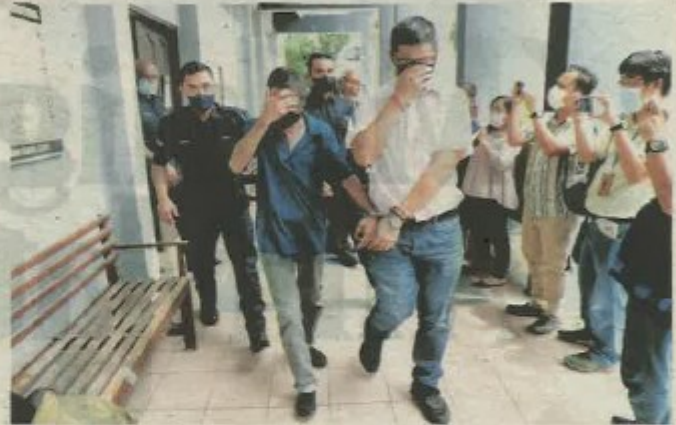
DUA daripada tiga individu yang dikenakan denda RM791,775 oleh Mahkamah Sesyen Ipoh semalam.

Mahkamah bagaimanapun membenarkan permohonan pihak pembelaan untuk menangguhkan pembayaran denda sehingga proses rayuan di