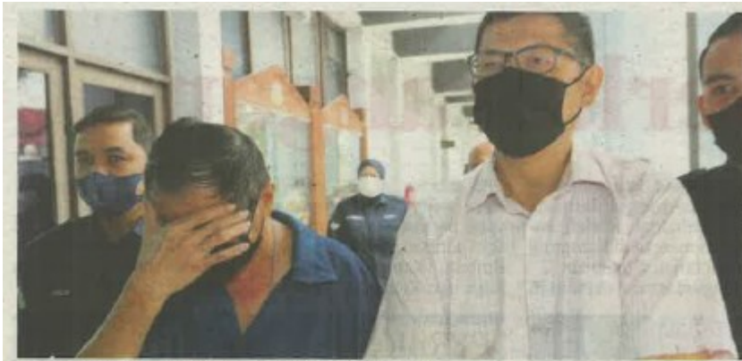
TERTUDUH dibawa ke Mahkamah Sesyen Ipoh, semalam.