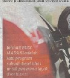
Inisiatif BUDI MADANI adalah satu program subsidi diesel khas untuk penerima layak.

Dianggarkan lebih 300,000 pemilik kenderaan diesel persendirian individu di Semenanjung layak untuk menerima BUDI Individu, manakala 68,000 petani, 8,000 penternak dan 34,000 peng-