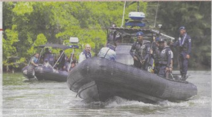
Domestic Trade and Cost of Living Minister Datuk Armizan Mohd Ali (front boat, left), along with members of the General Operations Force and Pengkalan Kubor Marine Police Force, patrolling the Malaysia-Thailand border yesterday.

priced at RM2.05 per litre while in Thailand, it retails for around 46 baht or RM5.91 per litre.