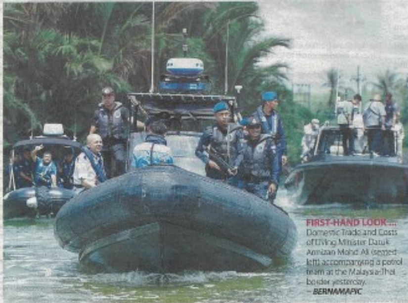
FIRST-HAND LOOK... Domestic Trade and Costs of Living Minister Datuk Amrihan Mohd Ali (seated left) accompanying a patrol team at the Malaysia-Thailand border yesterday.

The ministry added that the government will continue to monitor the global crude oil price trends and take appropriate measures to ensure the continued welfare and well-being of the people. — Bernama