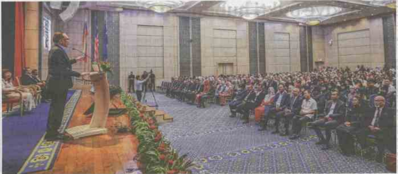
ANWAR Ibrahim menyampaikan ucapan pada Majlis Perhimpunan Bersama Warga Kementerian Kewangan di Putrajaya, semalam.