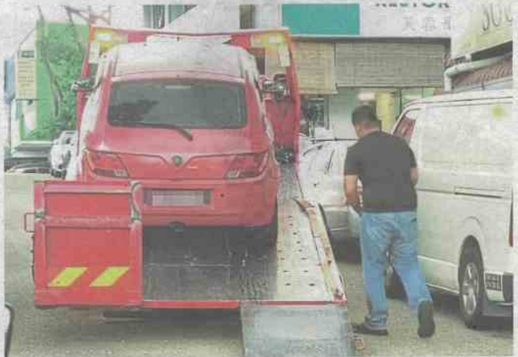
Driving up cost: Be prepared to pay more the next time your vehicle breaks down on the road as towing charges have increased by around 20% following the floating of diesel price.

"For vehicles with 2.0cc engines and above, the cost was RM200 to RM250 per trip, with higher prices