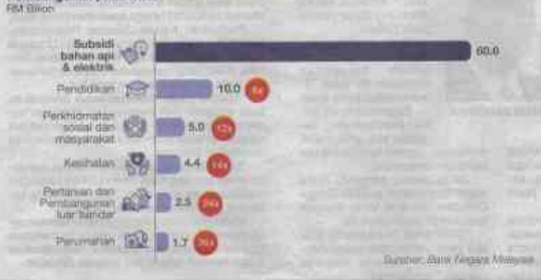
Rajah 3: Subsidi Tenaga berbanding Inisiatif Ekonomi & Sosial Lain di bawah Perbelanjaan Pembangunan pada 2022

“Walaupun peralihan daripada subsidi cukai kepada subsidi bernilai diesel tidak dinafikan akan meningkatkan tekanan inflasi namun subsidi bersasar dan langkah lain yang disertakan akan dapat membantu mengekalkan inflasi pada tahap yang rendah dan stabil,” katanya.