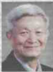
YEAH KIM LENG

Antaranya Menteri Kewangan II, Datuk Seri Amir Hamzah Azizan berkata, penetapan harga diesel di semua stesen runcit di Semenanjung pada kadar RM3.35 seliter itu harga pasaran tanpa subsidi itu dianggarkan dapat menjimatkan pihak kerajaan sebanyak RM4 bilion.