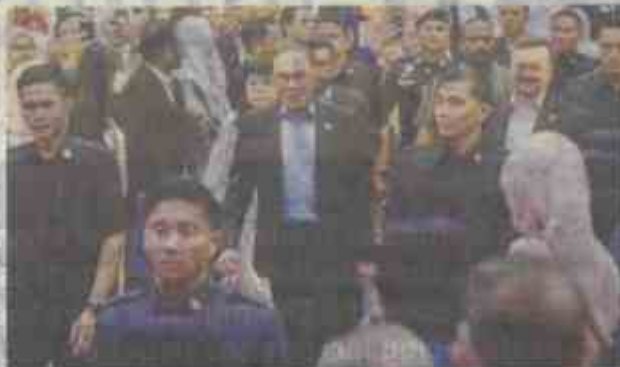
Prime Minister Datuk Seri Anwar Ibrahim arriving at the Finance Ministry's monthly assembly in Putrajaya yesterday.

Funds will be used for public transport and cash aid, not to raise ministers' pay, says PM