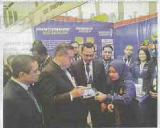
ANTHONY Loke Siew Fook (tengah) ketika melawat reruai pameran sempena Mesyuarat Pegawai Kanan Pengangkutan ASEAN Ke-57 (STOM) di Pulau Pinang, semalam.

"Kos pelancongan di negara kita memang cukup kompetitif. Mungkin ada sedikit kenaikan kos untuk pelancong asing, namun, saya rasa ia boleh diterima untuk pelancong asing," katanya.