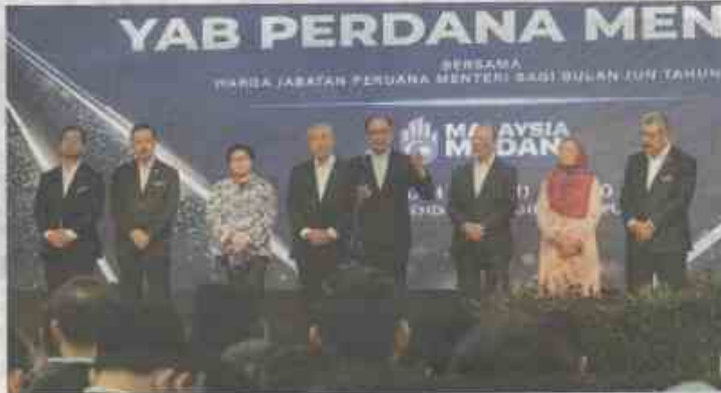
ANWAR Ibrahim ketika berucap dalam Perhimpunan Bulanun Warga Jabatan Perdana Menteri menyatakan semua Perdana Menteri sebelum ini telah setuju tetapi tidak ada tekad politik untuk melaksanakan penyasaran subsidi.

inilah pelaksanaan penyasaran subsidi diesel dan petrol RON95 oleh kerajaan akan mendapat sokongan mereka, tetapi bila pelaksanaan penyasaran subsidi diesel dihut pada 10 Jun terdapat pula geseran supaya ia ditangguhkan atau dibuat secara berperingkat.