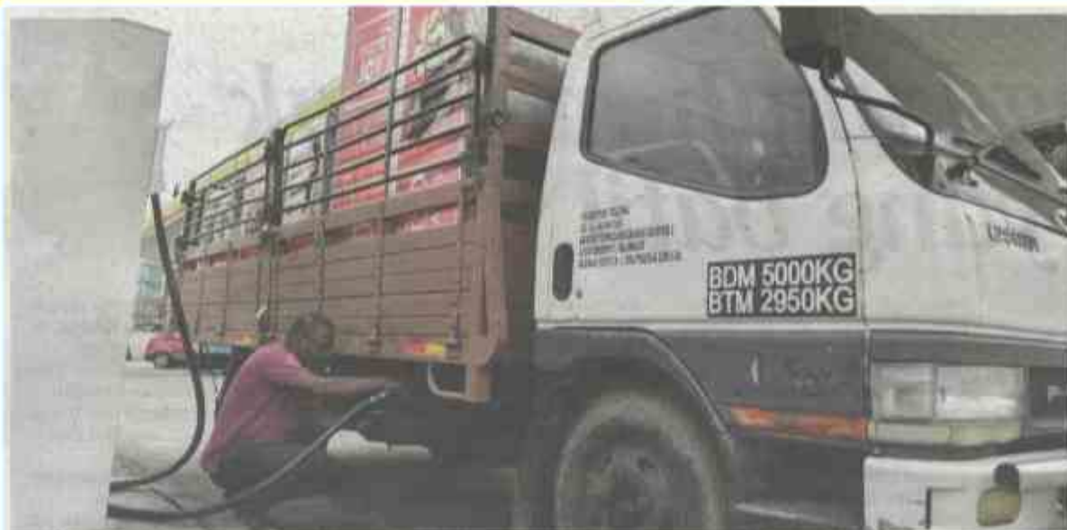
HARGA diesel di semua stesen minyak di Semenanjung ditetapkan pada kadar RM1.35 seliter mengikut harga pasaran tanpa subsidi.