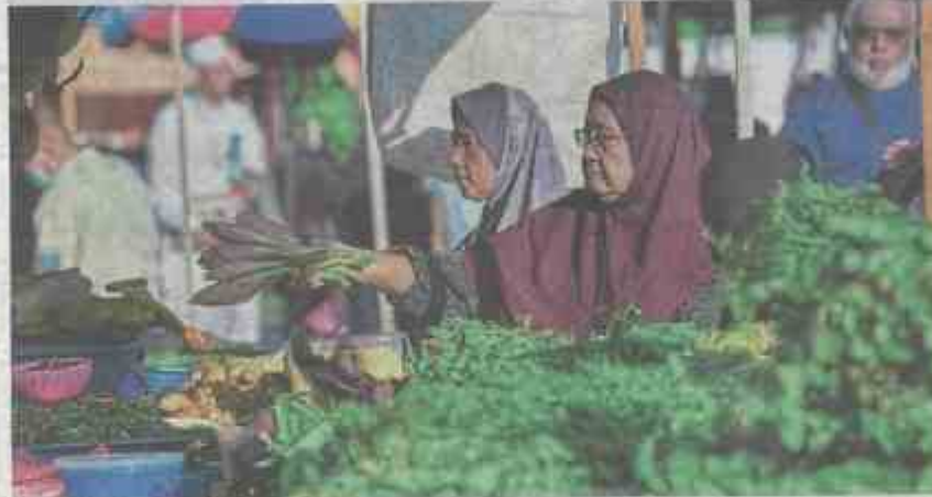
Business as usual: Residents shopping for daily necessities at the Ampangan Farmers' Market in Seremban.

"For sectors not included in the 33 types of public transport and