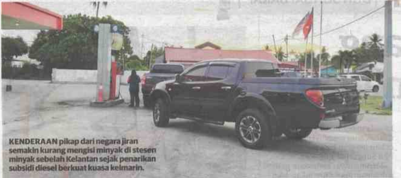
KENDERAAN pikap dari negara jiran semakin kurang mengisi minyak di stesen minyak sebelah Kelantan sejak penarikan subsidi diesel berkuat kuasa kelmarin.