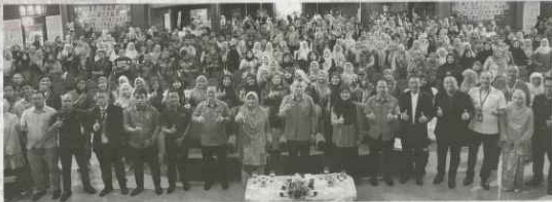
PENGANJURAN PBU24 di Kota Bharu. Kelantan telah mendapat sambutan meragakan daripada lebih 800 usahawan untuk menambah ilmu tentang aspek pengurusan perniagaan dan transformasi ke arah pendigitalan.

"Saya yakin ini pertama PBU24 ini mampu mencapai objektif yang ditetapkan di samping menjadi platform terbaik untuk menjejaki dan mempelodori ilmu keusahawanan dengan menggabungkan pengetahuan perniagaan kontemporari dengan teknologi dan digitalisasi terkini.