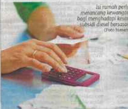
Isi rumah perlu merancang kewangan bagi menghadapi kesan subsidi diesel bersasar.

Dengan perancangan dan literasi kewangan yang baik, menjaga pendapatan tambahan, gaya hidup berhemat serta bantuan kerajaan, kita dapat mengurangkan impak kenaikan kos sara hidup dan memastikan kemiskinan tidak diwarisi generasi akan datang.