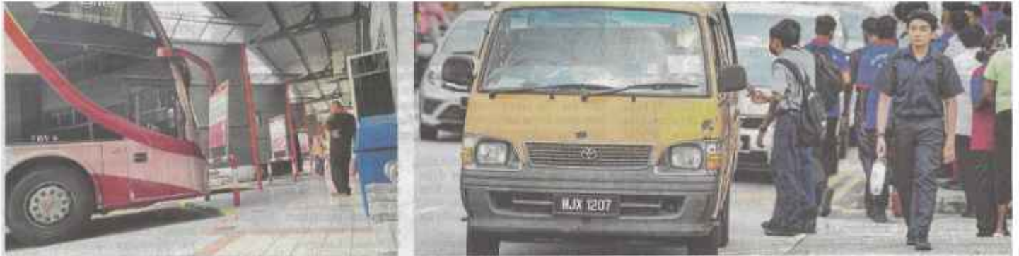
Pengusaha bus ekspres dan bus sekolah masih boleh membeli diesel di bawah harga kawalan, iaitu RM1.88 seliter.