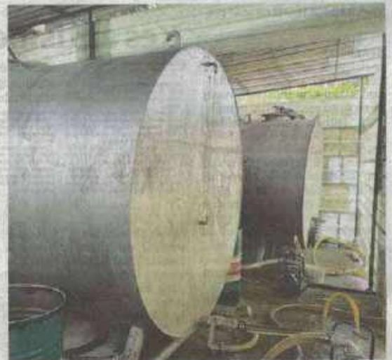
SEBAHAGIAN diesel yang dirampas dalam Op Tiris di KPDN Kuala Lumpur dalam tempoh Mac tahun lalu hingga Mei lalu.

Wang Haram, Pencegahan Pembiayaan Keganasan dan Hasil Daripada Aktiviti Haram 2001 (AMLA/FP/UA 2001)," katanya.