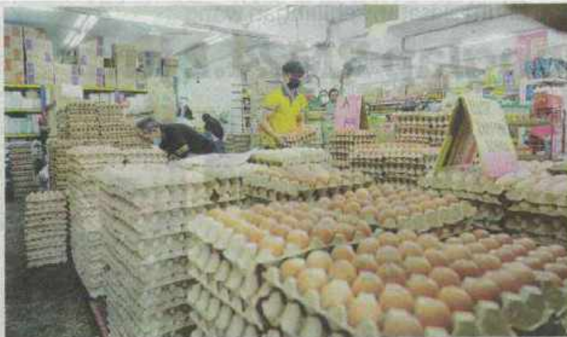
HARGA telur bagi Gred A, B dan C turun sebanyak 3 sen routai hari ini selepas kerajaan memperkenalkan penyiasaran subsidi diesel baru-baru ini. - GAMBAR HIASAN