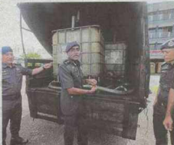
Johor police with a lorry seized for smuggling diesel in Tampoi recently.

Anwar also announced that the retail price of grades A, B and C eggs would be reduced by three sen per egg effective yesterday.