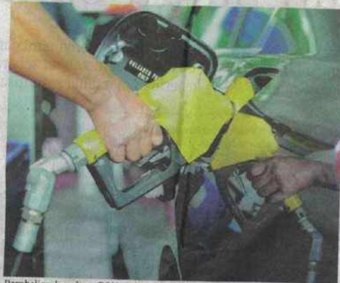
Pembelian berulang RON95 di semua stesen minyak tidak lagi dibenarkan di Kelantan.

Jelasnya, pihaknya akan menghantar surat kepada semua