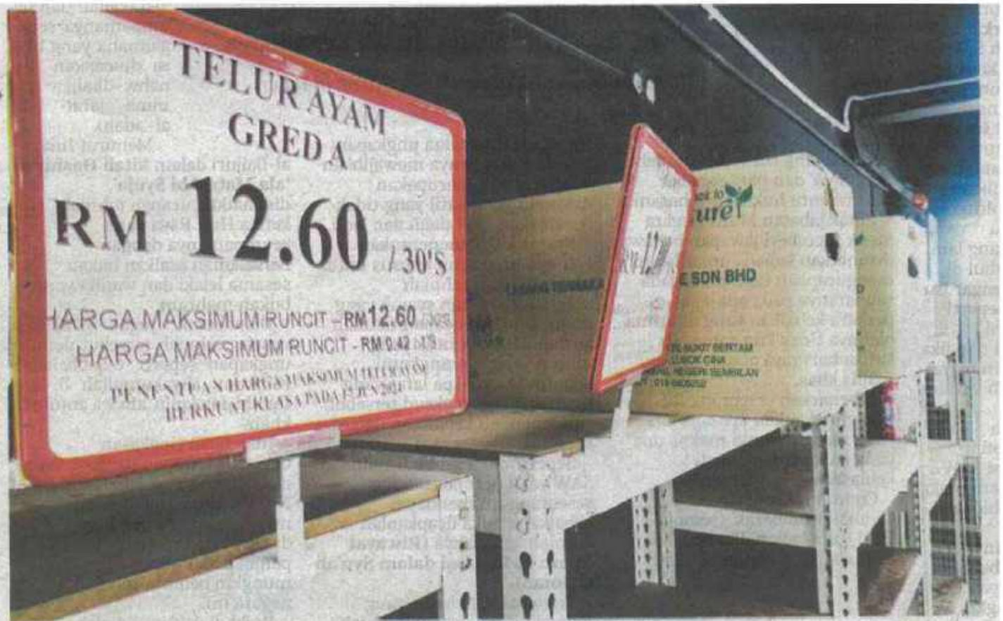
BEKALAN telur di sebuah pasar raya di Selayang dekat ibu kota kehabisan ketika tinjauan, semalam. Kerajaan memutuskan harga runcit bagi telur ayam gred A, B dan C di seluruh negara diturunkan 3 sen sebiji. Harga runcit baharu bagi telur ayam gred A, B dan C masing-masing ditetapkan 42 sen, 40 sen dan 38 sen sebiji berkuat kuasa semalam.