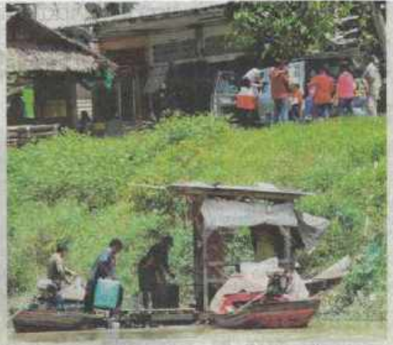
PENYIASARAN subsidi dilaksanakan untuk mengekang penyeludupan diesel oleh pihak tertentu. - GAMBAR HIASAN

Hasil penyiasaran subsidi diesel diserap ke barangan lain