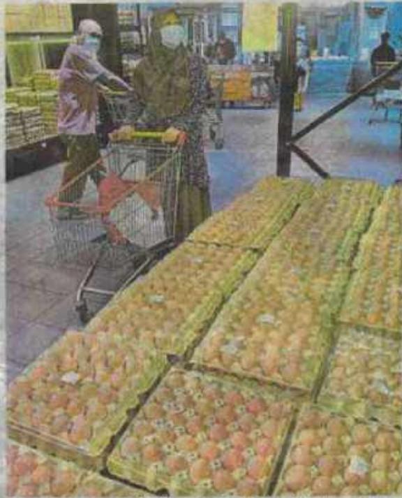
Penurunan harga runcit bagi telur gred A, B dan C dibuat selepas kerajaan mengambil kira perkembangan semasa yang menunjukkan penurunan kos input pengeluaran telur ayam. (Foto hiasan)

menegaskan, kerajaan komited menangani pengelutupan bahan api itu sambil berusaha mengimbangnya dengan perihal bekalan dan kos sara hidup rakyat.