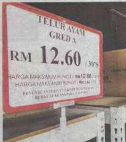
The retail price of grades A, B and C eggs has been reduced by three sen per egg effective yesterday. Last year, the government spent RM927 million on subsidies for chicken eggs.

He said the retail price for grades A, B and C eggs would be 42 sen, 40 sen and 38 sen, respectively.