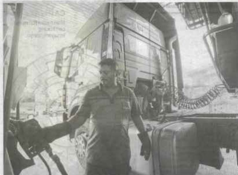
TIADA kewajaran untuk menaikkan harga barangan dan perkhidmatan ekoran subsidi diesel.

Presiden Persatuan Pengguna Pulau Pinang (CAP)