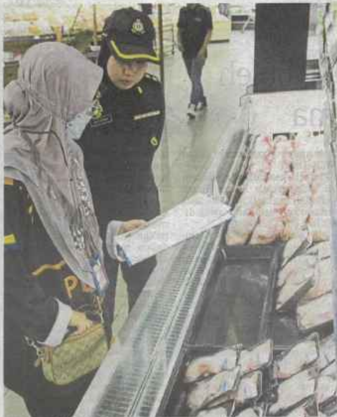
Anggota KPDN Perlis memeriksa harga ayam pada Ops Kesan 2.0 di sebuah pasar raya di Perlis, Ahad lalu.

Putrajaya: Kementerian Perdagangan Dalam Negeri dan Kos Sara Hidup (KPDN) mengeluarkan notis terhadap seorang peniaga selepas didapati menjual gas petroleum cecair (LPG) melebihi harga kawalan.