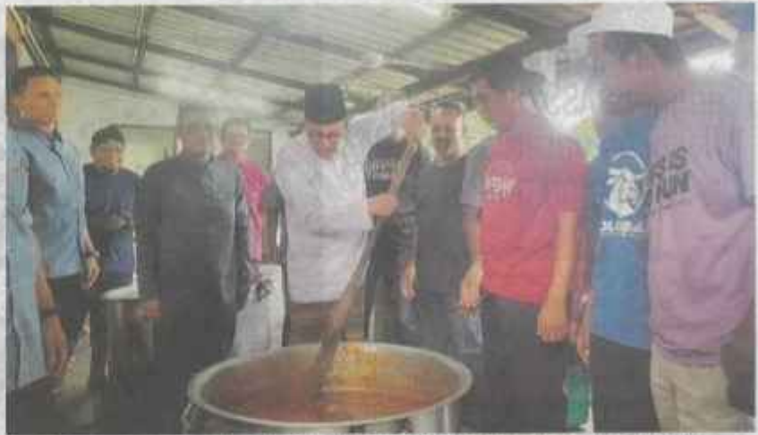
Anwar menyantuni kariah Masjid Jamek Cerok Tokun Bawah pada Selasa.

"Daripada tahun 2012 hingga 2022 kita tengok berapa jumlah kereta bertambah, kata 3 peratus. Berapa jumlah naik keperluan diesel?