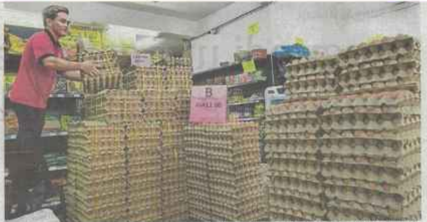
Kerajaan putuskan harga runcit telur ayam grad A, B dan C di seluruh negara diturunkan 3 sen sebiji selaras usaha mengembalikan hasil perimatan pengurangan subsidi kepada rakyat.

"Walaupun penurunan hanya tiga sen sebiji, ia tetap membantu pengguna memandangkan telur antara bahan makanan yang digunakan hampir setiap hari.