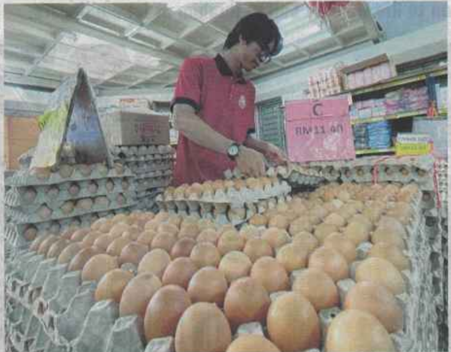
The reduction in prices of chicken eggs has brought cheer to traders as well as household consumers in the country.