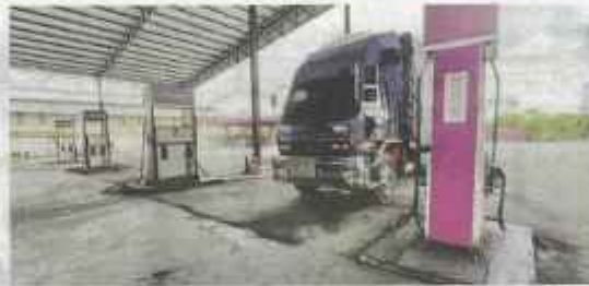
KENDERAAN perdagangan dari luar Malaysia boleh membuat pengisian diesel atau petrol di stesen minyak tanpa subsidi yang terdapat di Padang Besar dan Wang Kelian, Perlis.

ambil terhadap pengusaha stesen minyak yang bersekongkol dengan sindiket penyelewengan barang kawalan ini. Sekiranya mereka didapati bersalah akan disyorkan penggantungan lesen kepada pihak ibu pejabat," katanya kepada Utusan Malaysia.