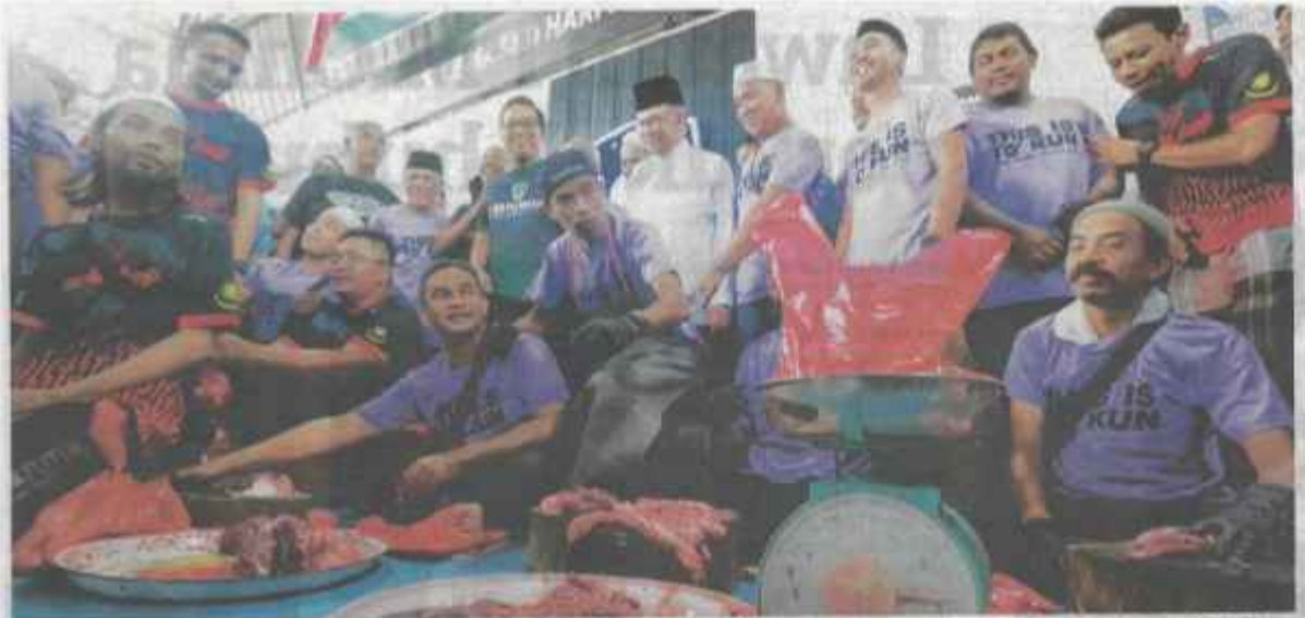
ANWAR Ibrahim (tengah) melihat proses melapah daging korban ketika menghadiri Program Korban Perdana di Masjid Jamek Cherok Tok Kun Bawah, Bukit Mertajam, Pulau Pinang.