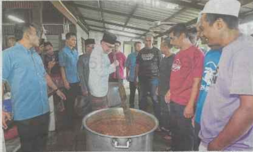
Anwar bersama penduduk begotang-royang memasak gulai ketika hadir Korban Perdana bersama Perdana Menteri di Masjid Jamek Gerak Tolak, semalam.

"Saya ambil sikap terbuka, kalau ada beberapa kelemahan, maklum, kita betulkan. Ini percubaan awal yang tentunya menghadapi sedikit sebanyak masalah, saya tidak nafikan tetapi cerca seolah-olah kerajaan zaitin, itu tidak boleh," katanya kepada pemberita selepas menghadiri Program Korban Perdana,