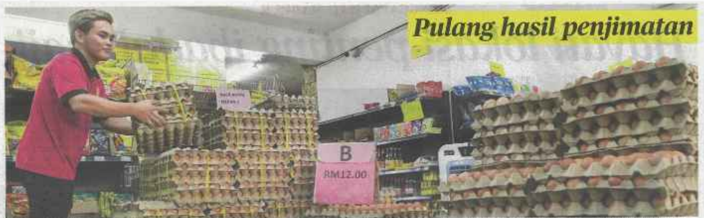
KERAJAAN memutuskan harga runcit telur ayam gred A, B dan C di seluruh negara diturunkan 3 sen sebiji selaras usaha mengembalikan hasil penjimatan penyusunan subsidi kepada rakyat. Kiri, harga runcit bagi telur ayam gred A, B dan C masing-masing turun kepada 42 sen, 40 sen dan 38 sen sebiji berkuat kuasa 17 Jun lalu. Penampungan subsidi keperluan makanan rakyat sebanyak 10 sen bagi sebiji telur ayam ini melibatkan perbelanjaan RM100 juta manakala pada tahun 2023 peruntukan subsidi telur ayam adalah sebanyak RM527 juta.