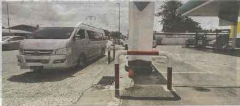
KENDERAAN dari Thailand tidak banyak kelihatan mengisi diesel di sekitar Padang Besar, Perlis, susulan pelaksanaan pelarasan subsidi diesel.

Katanya, meskipun harga diesel telah diapungkan, namun harganya masih rendah jika dibandingkan dengan Thailand dan aktiviti seludup diesel itu juga berkemungkinan masih berlaku.