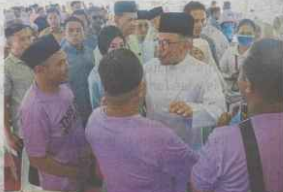
Prime Minister Datuk Seri Anwar Ibrahim mingling with the crowd at Masjid Jamek Cheruk Tok Kutu in Bukit Mertajam yesterday.

"This means that for decades, they have been enjoying our subsidised diesel. The same goes for fishing boats from Thailand," he said, referring to the foreign fish-