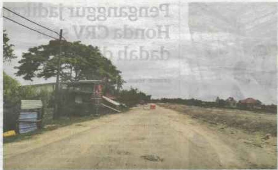
PENYASARAN subsidi diesel menyaksikan laluan Kasban di sempadan Malaysia-Thailand dekat Pengkalan Kubor lenggang daripada aktiviti penyeludupan.