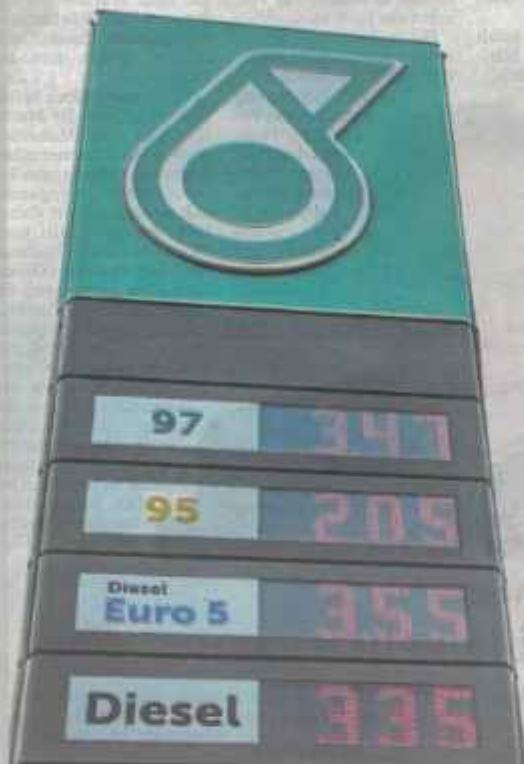
KERAJAAN menetapkan harga diesel di Semenanjung pada kadar RM3.35 se-liter bermula tarikh 10 Jun lalu.

Lelaki berusia 70 tahun itu yang menguasai gerai di Narathiwat berkata, dia dan peniaga Thailand lain kini menjual diesel Malaysia antara RM4 hingga RM4.20 se-liter kepada pemandu Thailand. Harga diesel semasa di Thailand adalah RM4.26