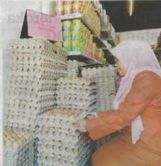
SEORANG pengguna melihat telur ayam grad C yang masih dijual pada harga lama iaitu RM12.30 sepapan di sebuah premis pemborong di Kampung Bukit Besar, Kuala Terengganu semalam.

Dia juga berharap golongan peniaga dan pemborong bertlov-