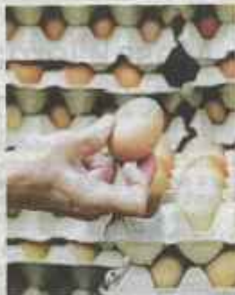
KERAJAAN mengumumkan telur grad A, B dan C turun sebanyak tiga sen dengan masing-masing berharga 42 sen, 40 sen dan 38 sen sejoli berkuat kuasa lebih laka.

Sementara itu, rata-rata peng- gina khususnya peniaga re-