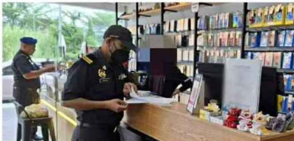
PENGUAT kuasa KPDN melakukan pemeriksaan di premis sekitar Kota Bharu sebelum menyita 1,207 aksesori telefon disyaki tiruan bernilai RM33,104.

"Semua barangan itu disyaki mempunyai pelanggaran mengikut Akta Cap Dagangan 2019 iaitu mempunyai dalam milikan, kawalan dan jagaan bagi maksud perdagangan suatu cap dagangan berdaftar dipakaikan dengan salah pada barangan atau perkhidmatan.