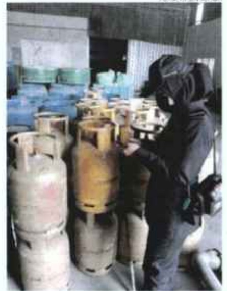
Anggota KPDN memeriksa tong LPG di sebuah kilang sarung tangan getah di Tangkak.

Manakala bagi kesalahan kedua dan seterusnya denda tidak melebihi RM3 juta atau penjara tidak melebihi lima tahun atau kedua-duanya sekali.