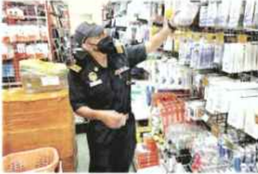
Seorang anggota penguat kuasa KPDN Kelantan memeriksa aksesori telefon bimbit yang dijual di salah sebuah kedai yang diserbu di Kota Bharu.

KOTA BHARU - Kementerian Perdagangan Dalam Negeri dan Kos-Sara Hidup (KPDN) Kelantan menyita 1,207 unit aksesori telefon bimbit tiruan bernilai RM33,104.