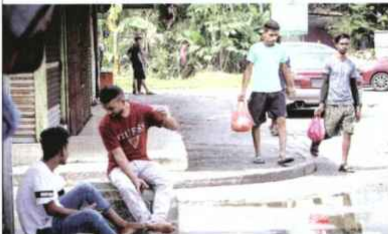
WARGA asing menjadikan kawasan lot kedai di Flat Bandar Suleiman, Klang sebagai tempat untuk bersembang sesama mereka.

“Ada juga langgar syarat pas apabila sepatutnya berada di sektor pembinaan, namun bekerja sebagai juruwang kedai runcit,” katanya.