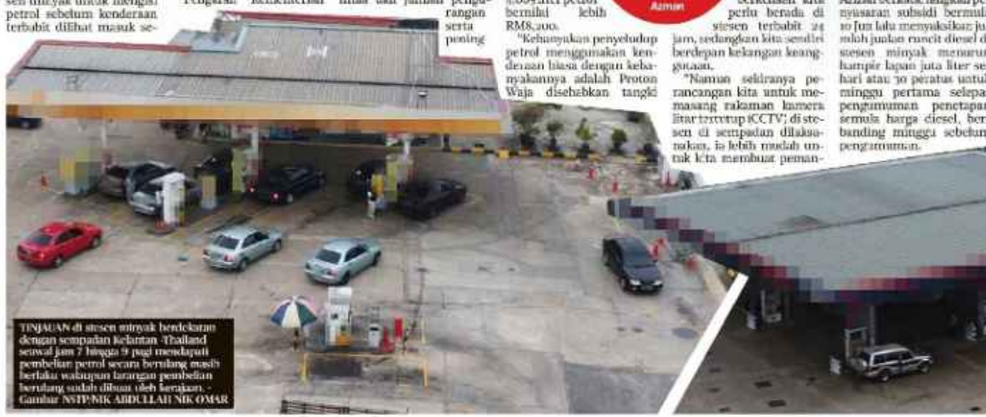
TINJAUAN di stesen minyak berdekaran dengan sempadan kelantan-Thailand seawal jam 7 hingga 9 pagi mendapati pembelian petrol secara berulung masih berlaku walaupun larangan pembelian berulung sudah dibuat oleh kerajaan.

“Kebanyakannya adalah Proton Waja disebabkan tangki yang besar” Azma