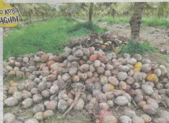
Kekurangan kelapa menyebabkan harga di pasaran meningkat mendadak.