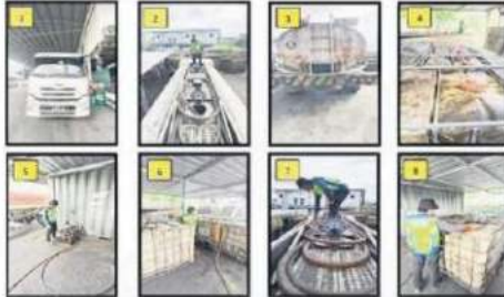
HASIL SERBUAN: Tangkapan dan rampasan oleh pasukan Cawangan Risik Batalion 10 PGA Sibu di sebuah premis semalam.

"Pasukan serbuan turut merampas dua buah lori yang dipercayai digunakan dalam kegiatan ini," katanya dalam satu